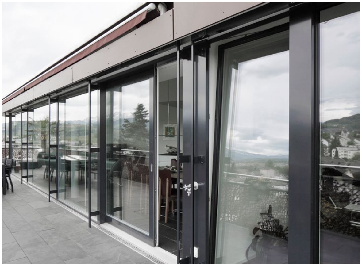
Mehrfamilienhaus Abtwil (Schweiz)