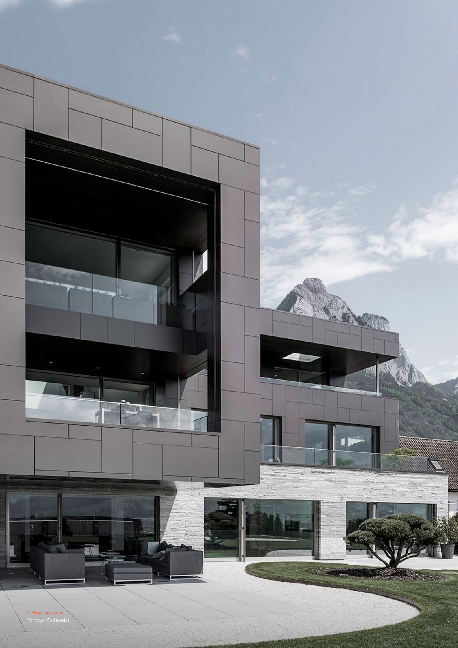
Einfamilienhaus Schwyz (Schweiz)