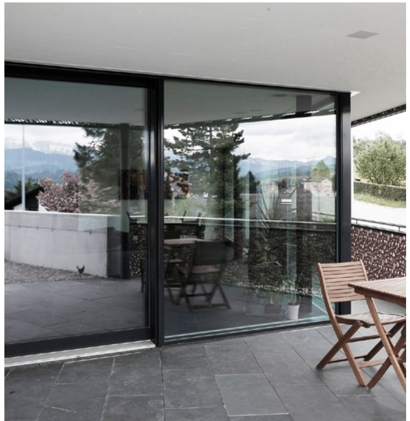
Mehrfamilienhaus Abtwil (Schweiz)