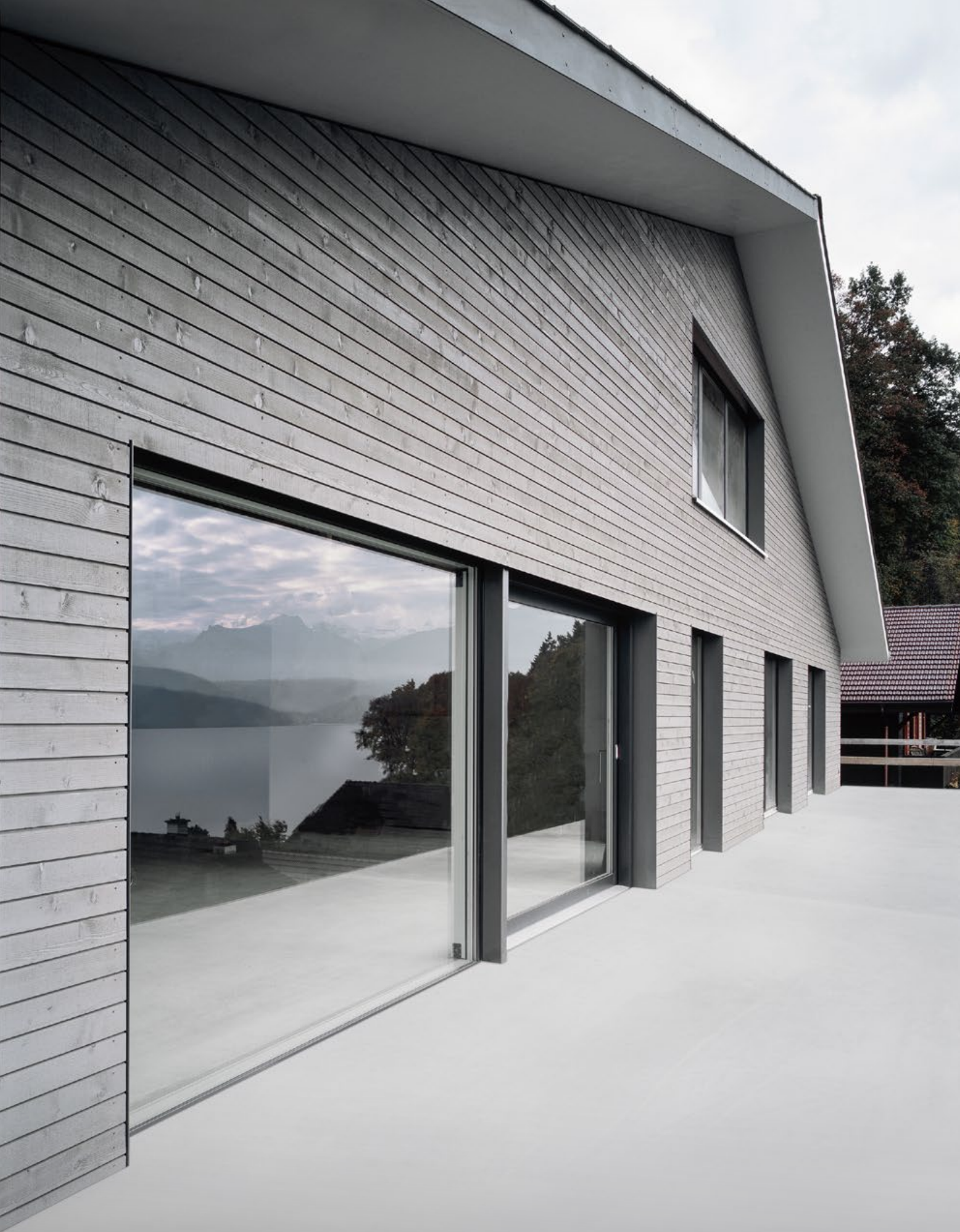
Einfamilienhaus Oberhofen (Schweiz)