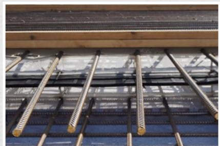
Klapp-Form fertig montiert