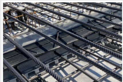
Anschliessend Fugenbänder/Bleche einfach einführen und obere Armierung auflegen