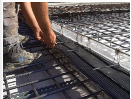
...und zeitsparend versetzen