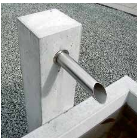
Brunnenstock Junior mit eckigem oder rundem Auslauf