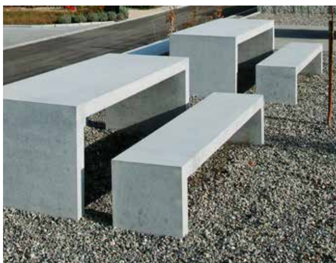
INTERMEZZO® Tisch und Bank

Diese funktionellen Kunstwerke sind aus einem Guss gefertigt. Mit der schlichten Ästhetik werden sie von Umgebungsdesignern, Planern und Architekten sehr geschätzt, und bevorzugt im öffentlichen Raum eingesetzt. Farbtupfer zum schlichten Grau des Betons bilden die farbigen, wasserdurchlässigen Sitzeinlagen aus unverwüstlichem Kunststoff.