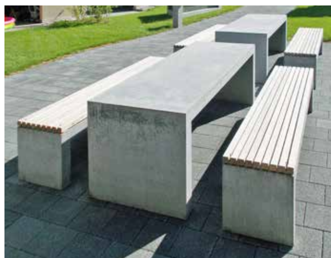
Holzrost aufliegend ohne Lehne