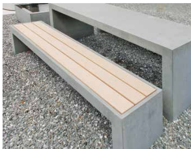
Bank mit Vertiefung und Holzsteinlage aus Sipo-Holz