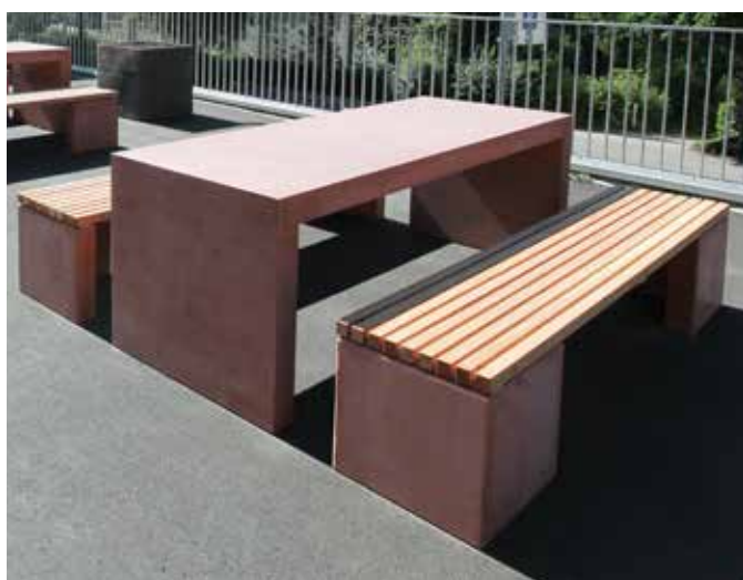
Masse Holzrost: L 140 / 220 cm, B 45 cm, H 5 cm

Variabänke bestehen aus zwei Betonwinkeln und einer Sitzauflage aus zähem Lärchenholz. Die Winkel können symmetrisch oder asymmetrisch angeordnet werden und stellen als Einzelobjekt oder in Gruppen einladende Sitzgelegenheiten dar. Sehr schön präsentieren sich die Variabänke als Einheit mit den klassischen INTERMEZZO® Tischelementen.