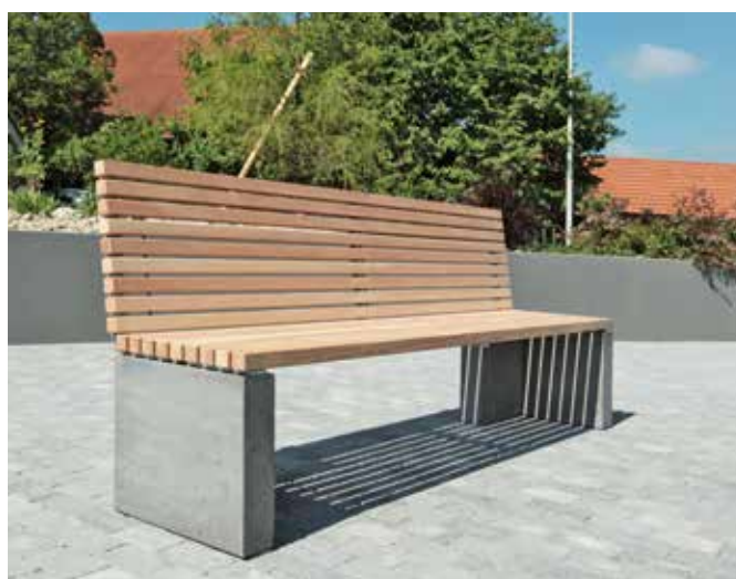
Masse Holzrost mit Rückenlehne: L 220 cm, B 45 cm, H 5 cm, H Rückenlehne 50 cm Holzart: Lärchenholz unbehandelt, gehobelt