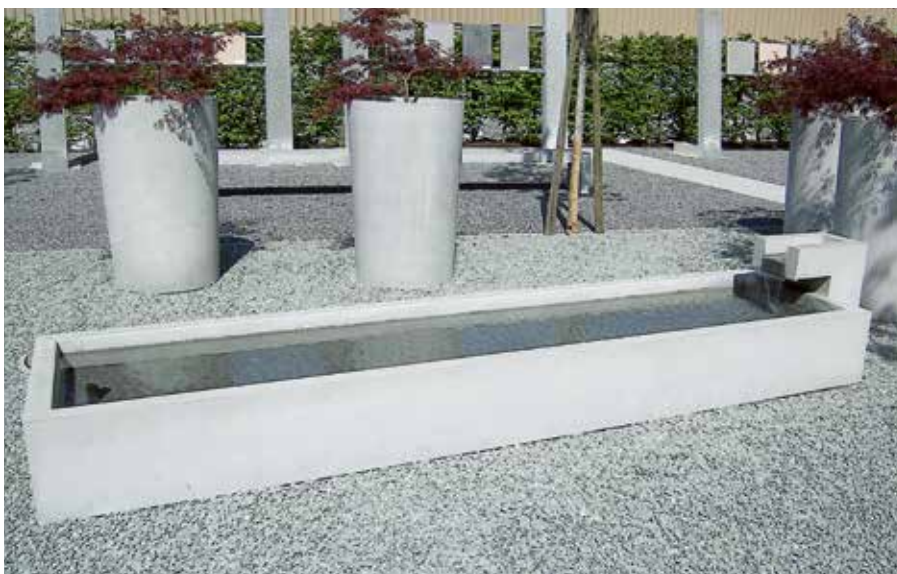
L 90, B 90, H 37 cm (Inhalt 130 l), L 200 (Inhalt 325 l), L 360 cm (Inhalt 620 l)

INTERMEZZO® Elemente sind zeitlos faszinierend, edel und wertbeständig. Wasserbecken können auch in individuellen Grössen, ganz Ihrer speziellen Situation angepasst, hergestellt werden.