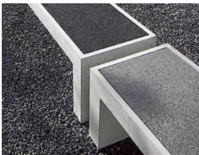
Sitzeinlagen aus wasserdurchlässigem Kunststoff