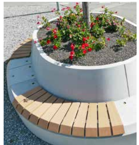
Die Holzrostauflage 60° wird mit 4 Dübeln auf das Radiumelement 90° geschraubt und kann bei Bedarf demontiert werden.