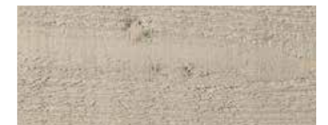
Farbtone Nr. 4832-M