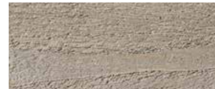
Farbtone Nr. 4470