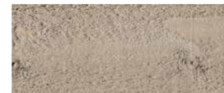
Farbtone Nr. 4470-M