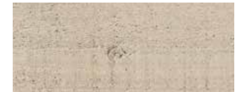
Farbtone Nr. 4832