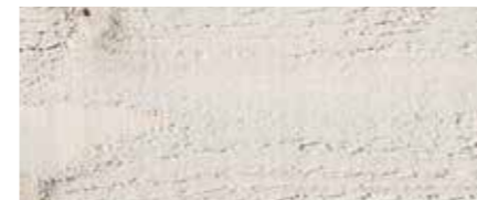
Farbtone Nr. 4861