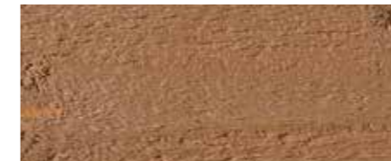
Farbtone Nr. 4735