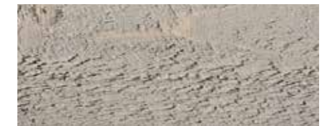
Farbtone Nr. 4870