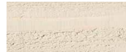
Farbtone Nr. 4863