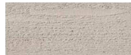
Farbtone Nr. 4259-M