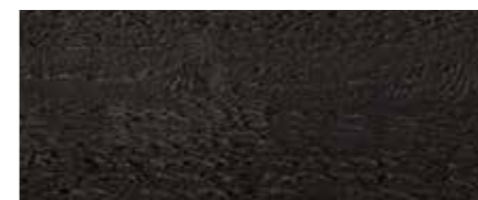
Farbtone Nr. 4895