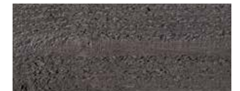
Farbtone Nr. 4890