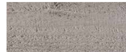
Farbtone Nr. 4880