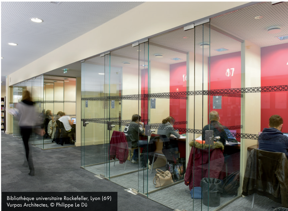
Bibliothèque universitaire Rockefeller, Lyon (69) Vurpas Architectes