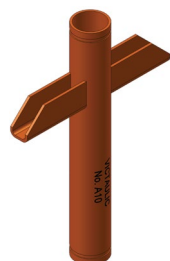
2 – 3"/DN50 – DN80