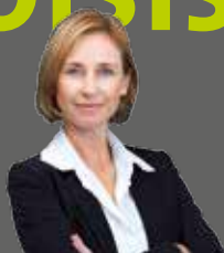
CHRISTINE MANIGEL MANIGEL ARCHITECTS

„ ... CAR MES PROJETS SONT FAITS POUR DURER ÉTERNELLEMENT! AVEC RESITRIX®, J'AI LA CONVICTIION QUE MON TRAVAIL GARDERA SON BEL ASPECT MÊME APRES PLUSIEURS DECENNIES, QU'IL N'Y AURA PAS DE PROBLEME ET QUE LE CLIENT SERA SATISFAIT!“