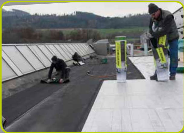
Raccordement étanche sans chan- gement de matériau