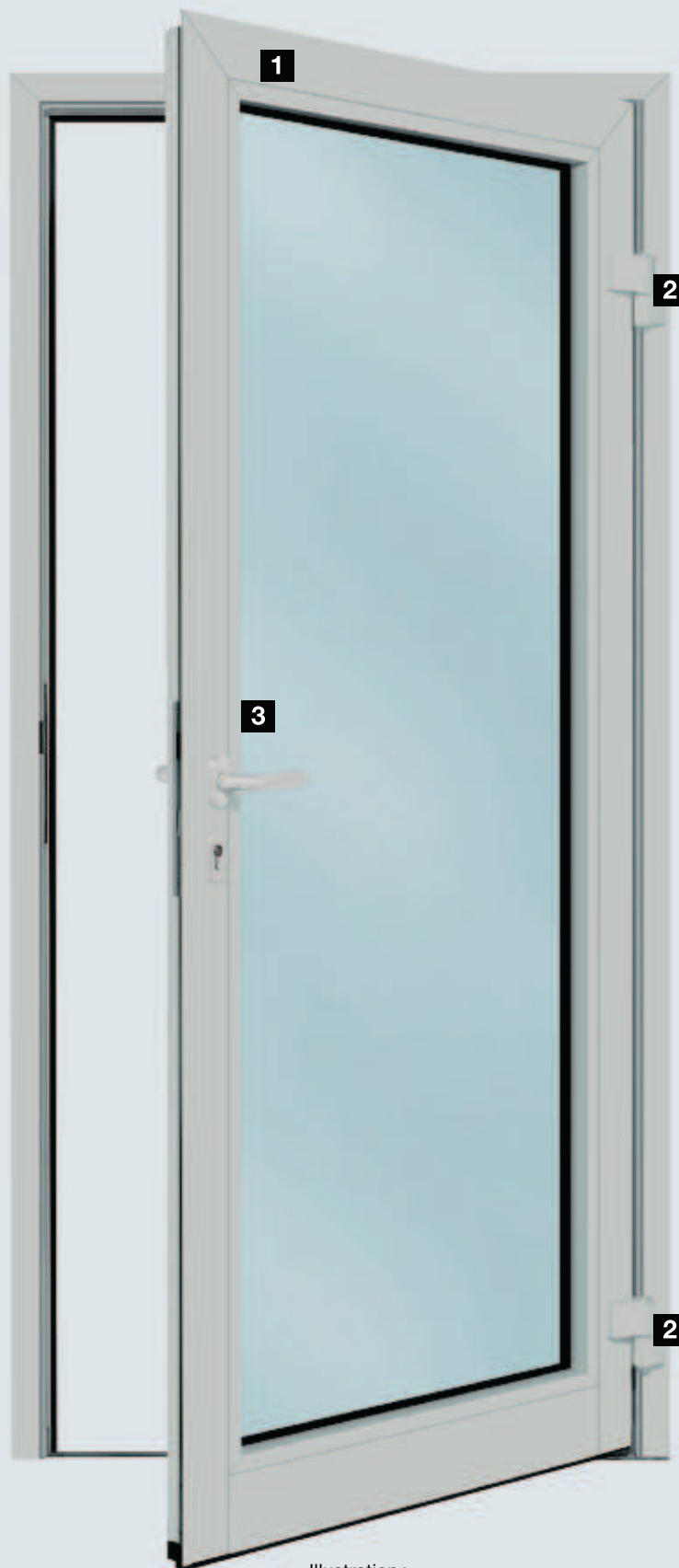
Illustration : Vantail de porte et cadre avec revêtement ultra brillant à base de poudre en gris lumière (comparable au RAL 7035) avec béquillage de couleur identique (en option)