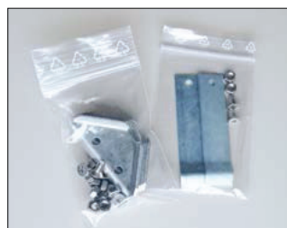
Fixations d'angle, pattes de scellement, visserie (livrées séparément, non montées)