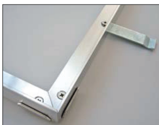
Cadre avec fixation d'angle et patte de scellement (non montées)