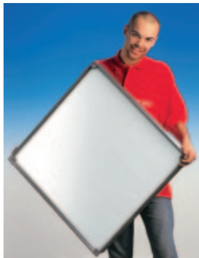
Typ CLA composite light das Super-Leichtgewicht

Liefern und nach Vorschrift des Herstellers versetzen. Hersteller: HAGO A-4600 Wels www.hago.at