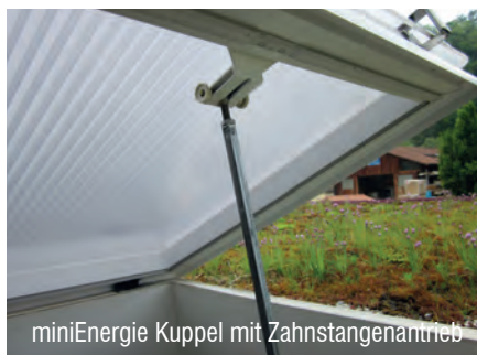
miniEnergie Kuppel mit Zahnstangenantrieb