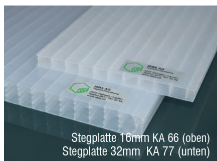
Stegplatte 16mm KA 66 (oben) Stegplatte 32mm KA 77 (unten)