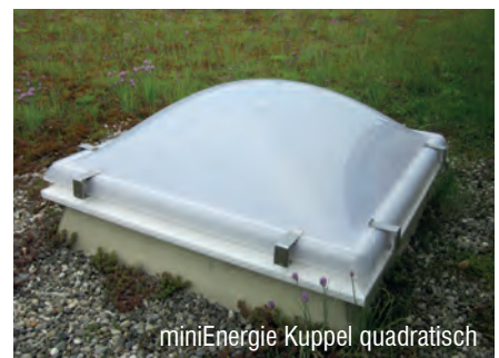
miniEnergie Kuppel quadratisch