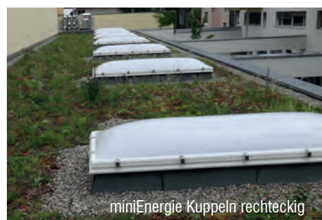
miniEnergie Kuppeln rechteckig