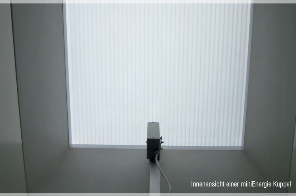
Innenansicht einer miniEnergie Kuppel