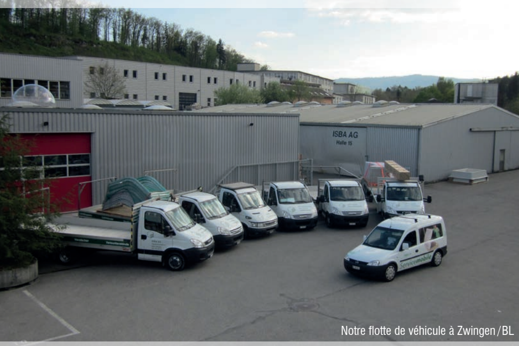
Notre flotte de véhicule à Zwingen /BL