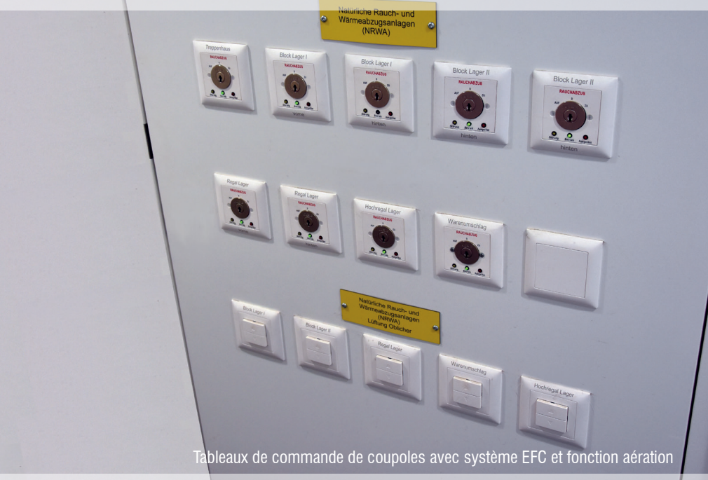
Tableaux de commande de coupoles avec syst4me EFC et fonction a4ration