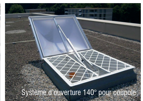
Syst4me d'ouverture 140° pour coupole