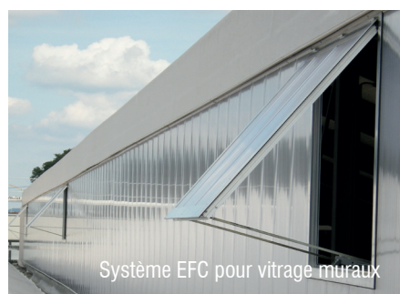
Syst4me EFC pour vitrage muraux