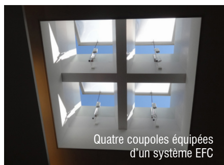
Quatre coupoles équipées d'un système EFC

Coupole translucide pour l'évacuation de fumée et chaleur avec entraînement par chaîne