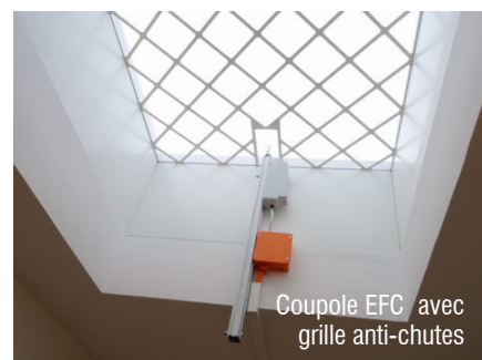
Coupole EFC avec grille anti-chutes