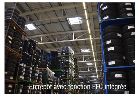
Entrep4t avec fonction EFC int4gr4e

Tous les jours, notre 4quipe du Team-Service sillonne le territoire Suisse pour des mises en service ou l'entretien de syst4mes EFC. Contactez-nous directement par E-Mail sous info@isba.ch ou par t4l4phone +41 61 761 33 44.