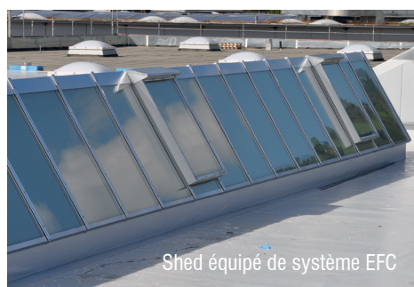
Shed 4quip4 de syst4me EFC