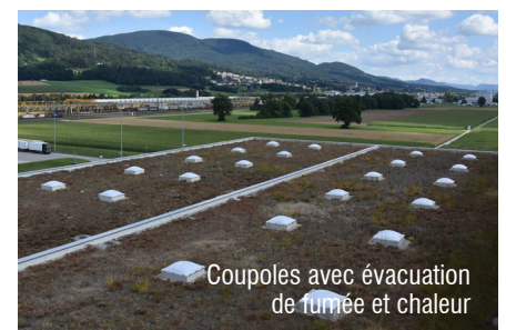
Coupoles avec 4vacuation de fum4e et chaleur