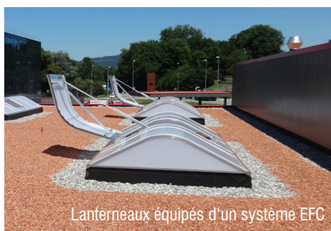
Lanterneaux équipés d'un système EFC