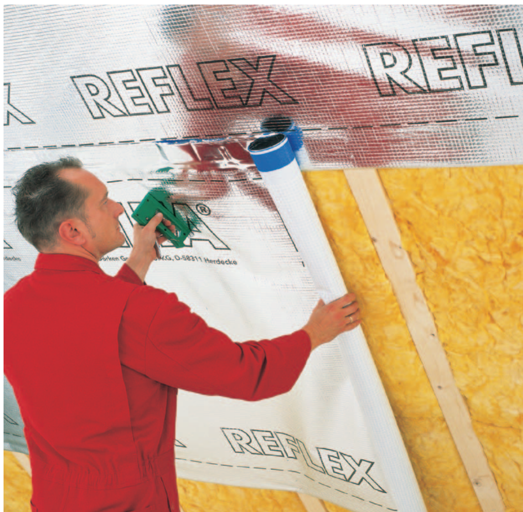
DELTA®-REFLEX PLUS – die universelle Luft- und Dampfsperre.