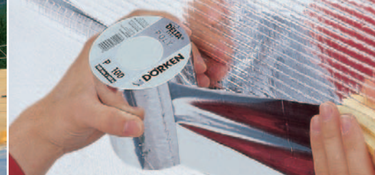
Integrierter Selbstkleberand für luftdichte Verlegung.