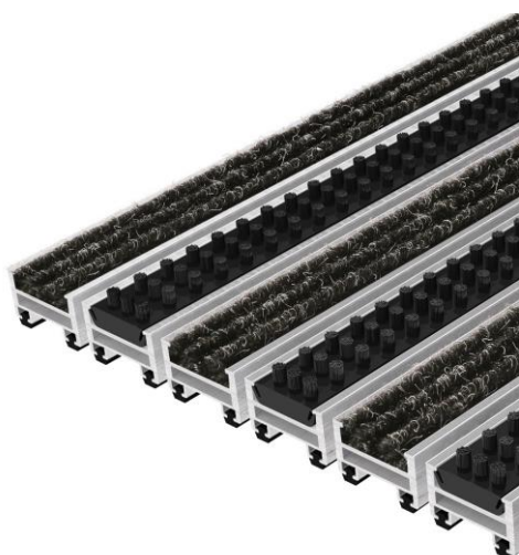
photo représenter tapis avec hauteur 22 mm