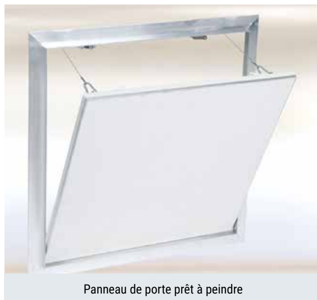
Panneau de porte prêt à peindre

Entre le cadre et le panneau de porte est un entrefer d'air de 1,5 mm, équipé d'un joint périphérique. Les fermetures à ressort invisibles permettent une ouverture par simple pression sur la trappe.