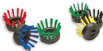
Éléments d'assemblage pour KARO AS et DOMINO