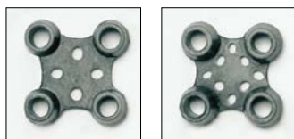
Éléments d'assemblage pour KARO AS et DOMINO