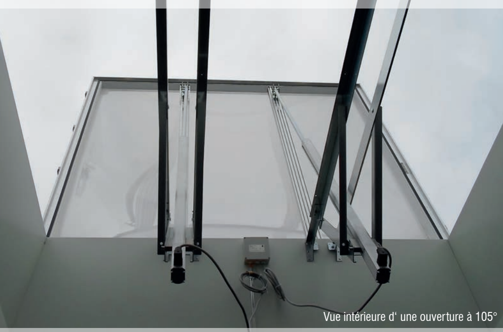
Vue intérieure d' une ouverture à 105°