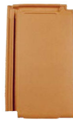
Lüftungsziegel mit Gitter (1)

Pultabschlussziegel und Pultortgangziegel sind zusätzlich erhältlich. (1)