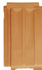
Lüftungsziegel mit Gitter (1)