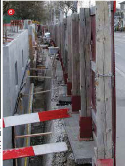
4: Enkadrain® TP sous la dalle de chaussée Klusweg 2, Meilen. 5: Enkadrain® ST – manipulation flexible Construction Goldschlägiareal, Schlieren. 6: Isolation du trafic de poids lourds et du tramway Construction Guggach, Zürich.

duire l'intensité des bruits de pas jusqu'à 38 dB (selon l'épaisseur de couches), mais aussi suffisamment rigide pour que les dalles ne bougent pas dans le cas d'une hauteur de couches normale. Elle s'utilise également avec un grand succès en tant qu'isolation des bruits d'impact sous des plaques de répartition de la charge soumises au passage de véhicules ou de piétons (photo 4).