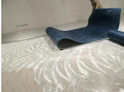
Einlegen der Matte in den Kleber

Der Dispersionskleber Uzin KE 2000 S wird mit einer Zahnpachtel A2 auf die Spachtelmasse aufgezogen . Der Kleber muss für 10 – 15 Minuten ruhen , bevor die Elastikschicht mit der Glasfaserschicht nach oben in den Kleber gelegt und auf die Länge zugeschnitten wird.