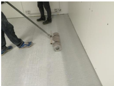
Abwalzen quer zur Matte

Nach einer Wartezeit von 10 Minuten wird mit einer mindestens 70 kg schweren Walze die Elastikschicht im Kreuzgang überarbeitet. Hierbei ist darauf zu achten, dass erst quer zur Bahn gerollt wird, um eventuell vorhandene Luft nach aussen zu drücken, dann wird die Bahn der Länge nach abgerollt und abschliessend nochmals quer .