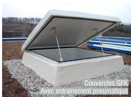
Couvercles GFK Avec entraînement pneumatique

Couvercles sur le toit du musée Charlie Chaplin, Corsier sur Vevey