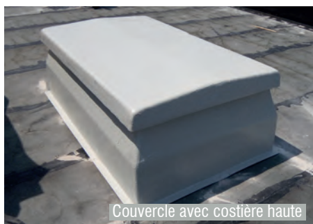
Couvercle avec costière haute

Nous nous ferons un plaisir de vous conseiller dans votre projet: Tel. + 41 61 761 33 44