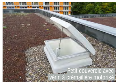
Petit couvercle avec vérin à crémaillère motorisé