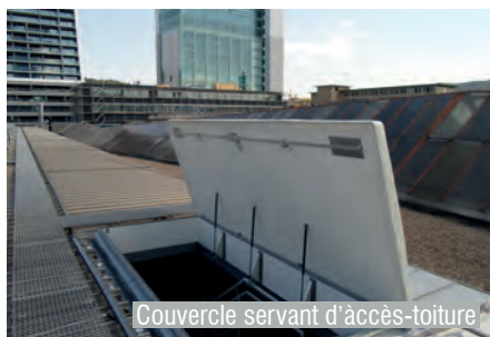
Couvercle servant d'accès-toiture

Afin de répondre aux exigences architectoniques, les couvercles peuvent être complétés par des clapets montés en interne. De ce fait, une ouverture de toit peut être conçue de telle sorte qu'aucun orifice n'apparaisse dans la dalle.