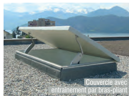
Couvercle avec entraînement par bras-pliant