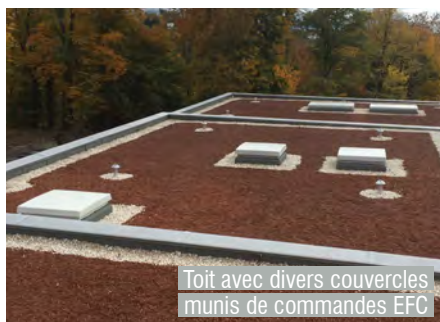
Toit avec divers couvercles munis de commandes EFC