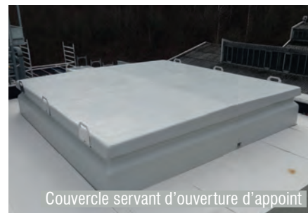
Couvercle servant d'ouverture d'appoint