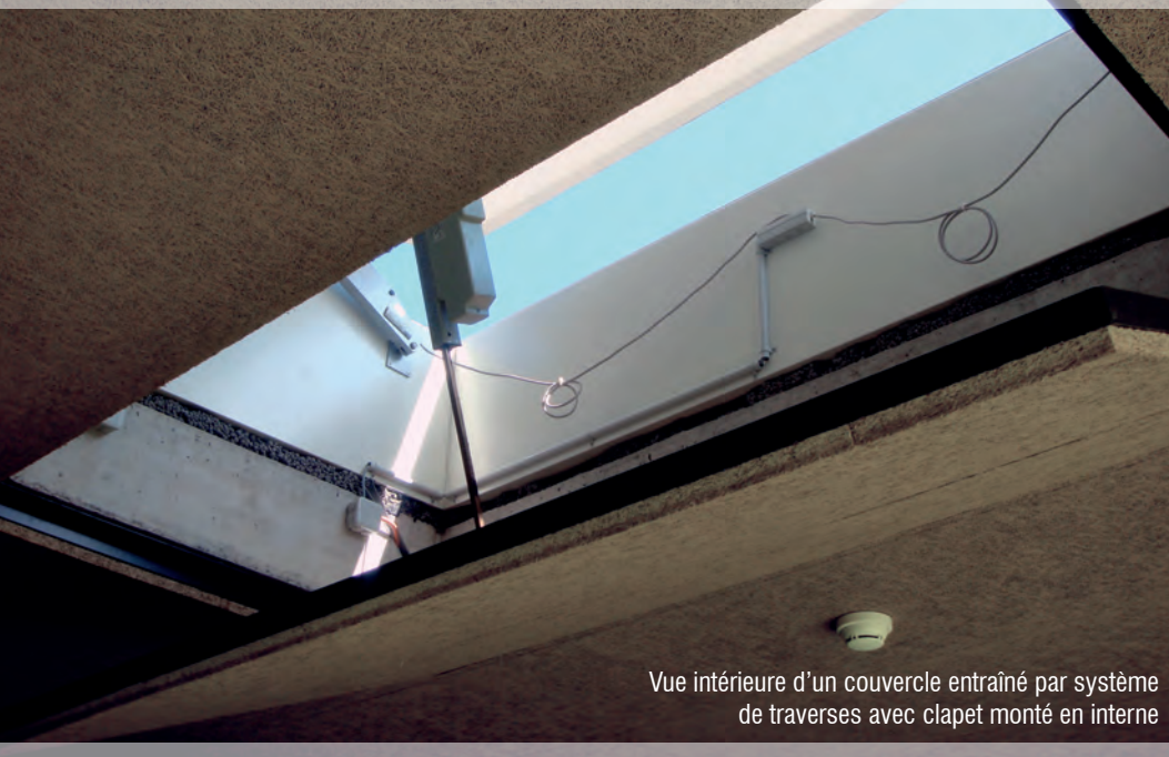
Vue intérieure d'un couvercle entraîné par système de traverses avec clapet monté en interne