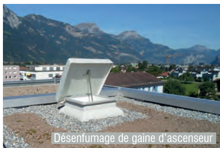
Désenfumage de gaine d'ascenseur