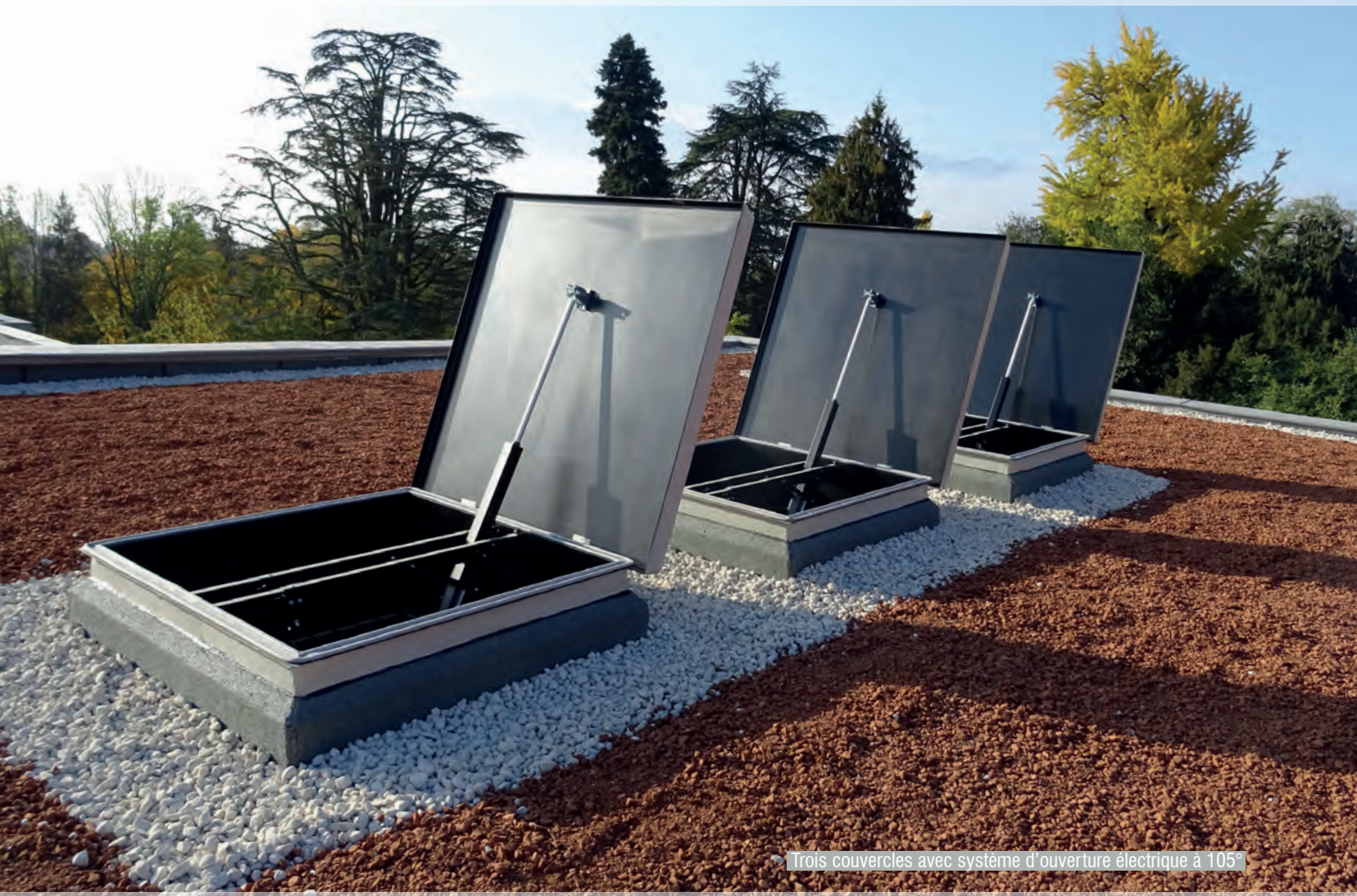
Trois couvercles avec système d'ouverture électrique à 105°