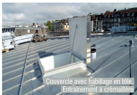
Couvercle avec habillage en tôle. Entraînement à crémaillère