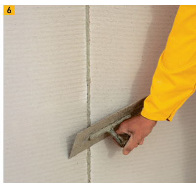
Du mortier est posé au niveau des joints vifs et l'excédent est raclé