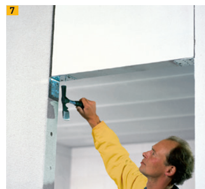
Équerre de porte