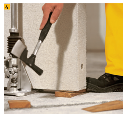
Fixation et alignement au moyen de cales en bois