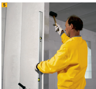
Alignement de l'élément de cloison Ytong