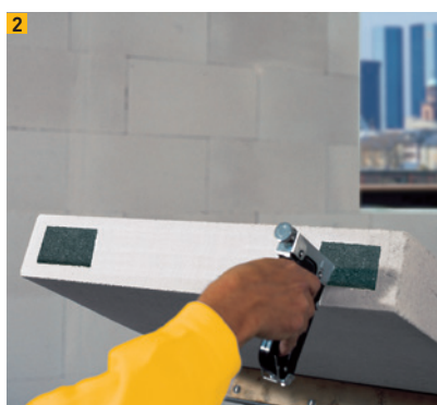
Pièce de caoutchouc pour le découpages des éléments