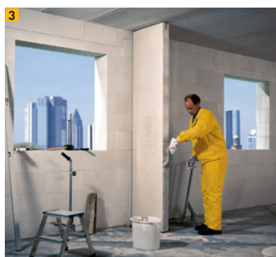
Positionnement de l'élément de cloison Ytong