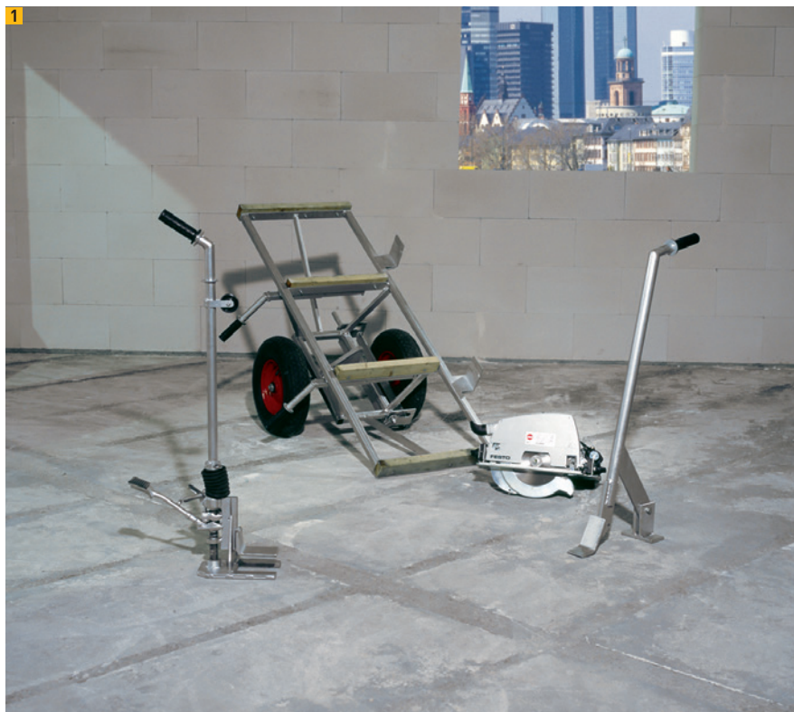
Dispositif de levage des éléments de cloisons Ytong

Les ouvertures de portes peuvent être créées avec des éléments de cloisons Ytong grâce à des châssis de la hauteur de l'étage avec des lucarnes ou des éléments de linteau découpés sur mesure. Les supports des linteaux sont soit sciés, soit fabriqués à partir d'équerres en acier galvanisé.