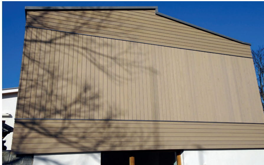
Einfamilienhaus in Oberwil